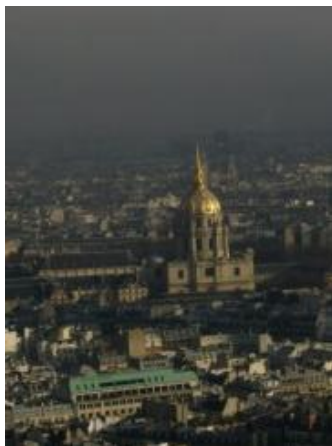
Dôme des Invalides